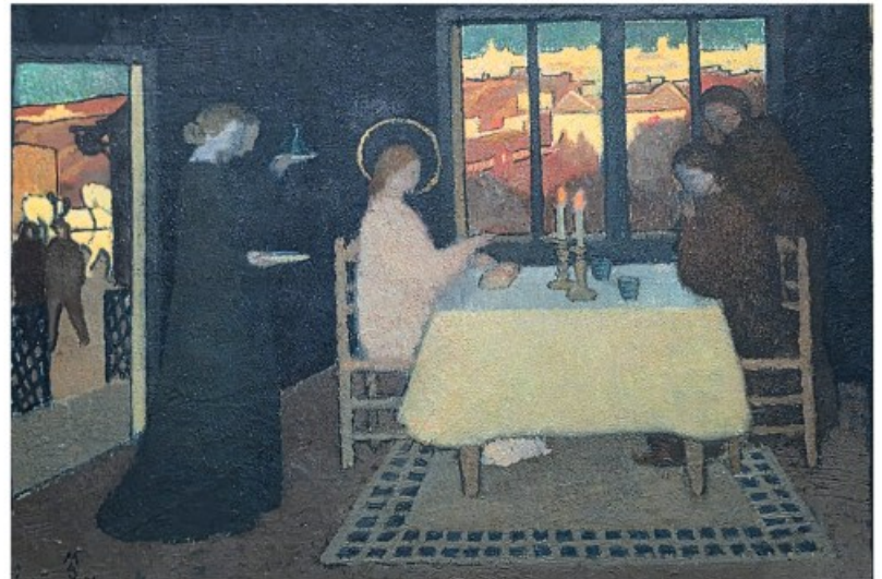
Maurice Denis, Die Emmausjünger, 1894

In Emmaus merken die Jünger: Sie waren und sind nicht allein, zu keiner Zeit. In der ganz realen Geste der Nächstenliebe, des Brotbrechens Jesu, realisieren sie: Er, Jesus Christus, ist da, lebendig. Ostern – da geht noch was! Es geht weiter für uns, trotz allem Leid, aller Trauer, allen Ängsten, trotz unserer Verzweiflung.