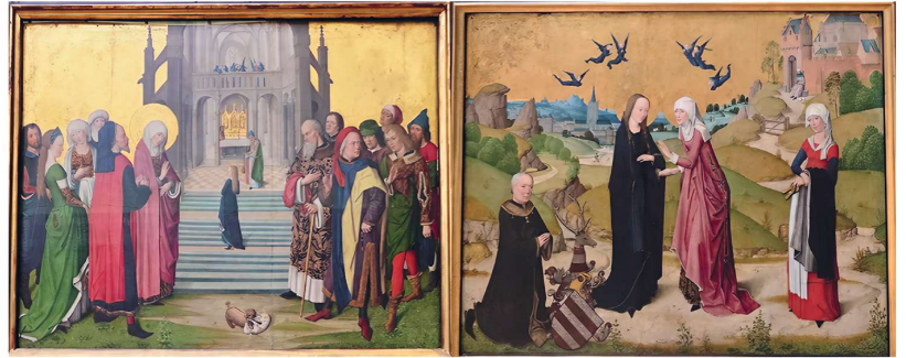
Meister des Marienlebens, Tempelgang Mariä und Heimsuchung Mariä, um 1470/80

Dass schwangere Frauen einander brauchen, ist das Normalste von der Welt. Das erste Kind, das sich im Leibe regt, stellt alles auf den Kopf. Erst recht, wenn es so außergewöhnliche Umstände sind wie bei der Jungen Maria und der älteren Elisabeth. Mariä Heimsuchung (2. Juli) ist also ein sehr menschliches Fest. Zugleich ist es ein sehr göttliches Fest, denn es bestärkt uns, wirklich zu glauben, dass „bei Gott nichts unmöglich“ ist; er geht sogar so weit, dass er selbst als Menschenkind in diese Welt eintritt! (Werdende) Mütter und Väter sind besonders wach dafür, dass dieses ver-